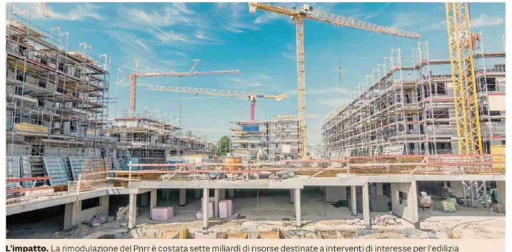
L'impatto. La rimodulazione del Pnrr è costata sette miliardi di risorse destinate a interventi di interesse per l'edilizia