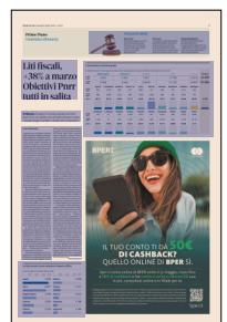
Peso: 1-2%, 9-50%

Adesso bisogna affrontare l'impegno preso con il Piano nazionale di ripresa e resilienza (Pnrr): entro il 2022 dovevamo tagliare il contenzioso della Cassazione tributa-